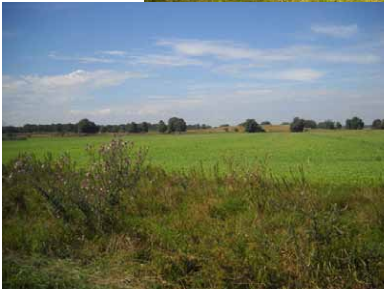
Am Biospährenreservat Bild 16