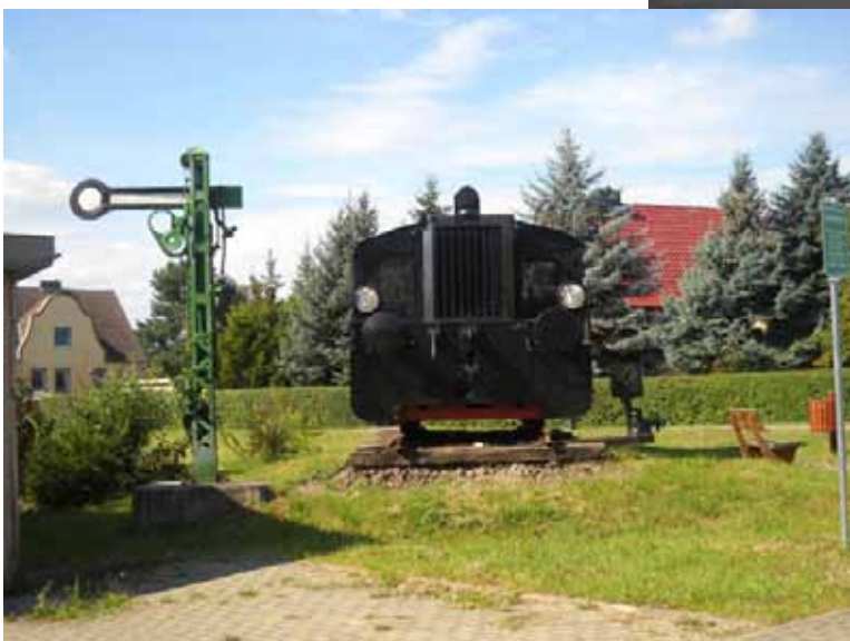
Eisenbahndenkmal in Gerwisch Bild 20