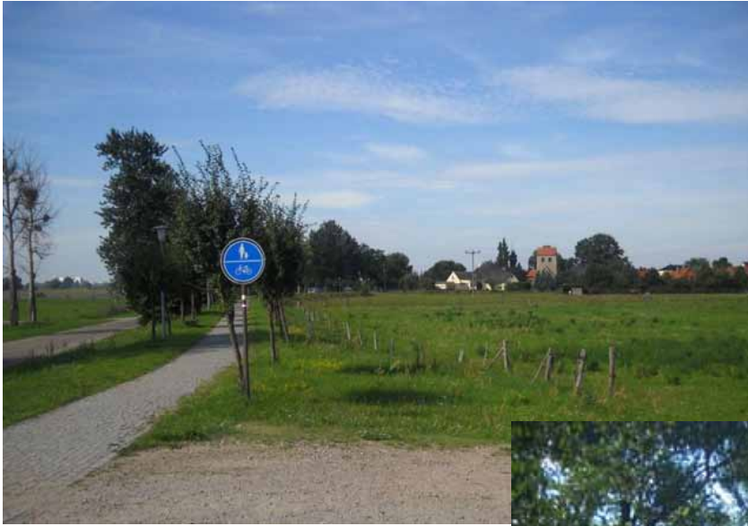
Alt-Lostau Bild 13