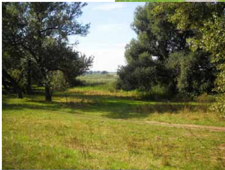
Elbwiesen vor Gerwisch Bild 15