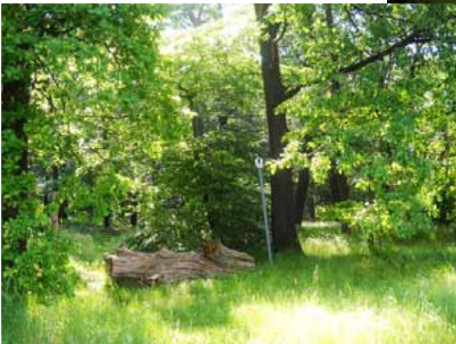
Eingang zum Schloßpark Bild 4