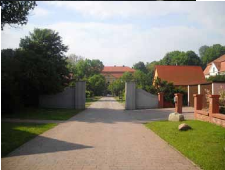
Vorhof des Schlosses Pietzpuhl Bild 2