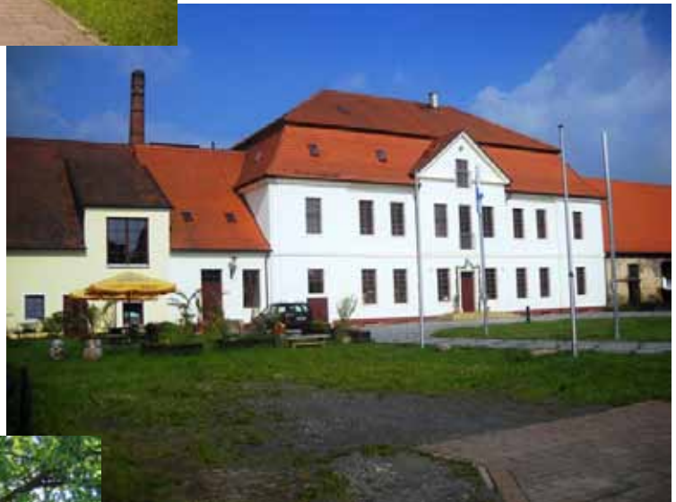
Kavaliershaus Pietzpuhl Bild 3