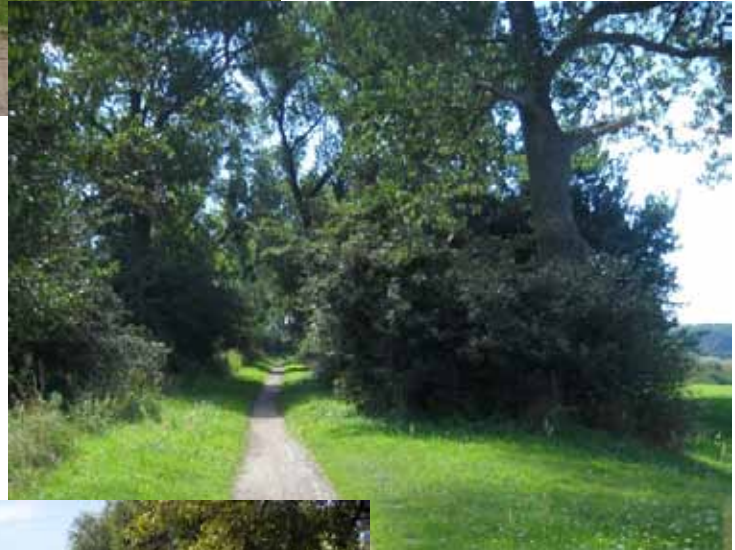
Alter Bahndamm Richtung Gerwisch Bild 14