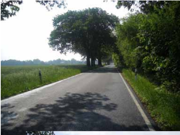
Straße nach Pietzpuhl Bild 1