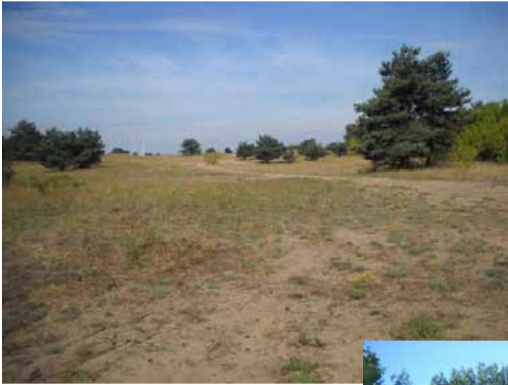
Die Heide "Zuwachs" im Norden von Gerwisch Bild 17